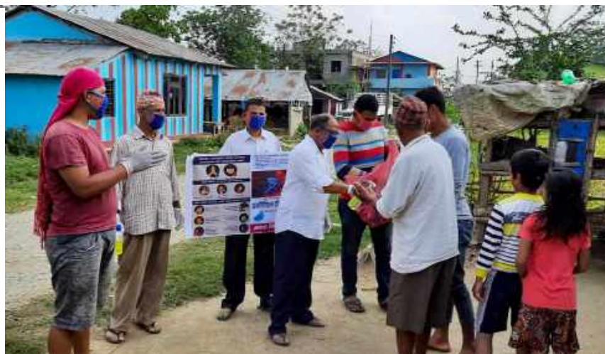
Einheimische Mitarbeiter von The Sowers Ministry reisen in viele abgelegene Dörfer, um Masken zu verteilen und die Menschen darüber aufzuklären, wie sie ihre Hände richtig waschen und gesund bleiben.